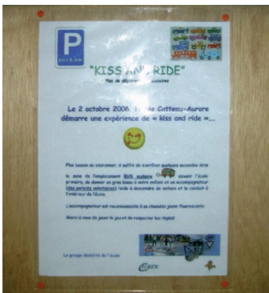
Ixelles École Robert Catteau-Aurore. Panneau d'information sur la zone de dépose-minute.

Afin d'impliquer davantage les parents et les enfants, certaines écoles font également signer une charte où ceux-ci s'engagent à respecter l'usage de la zone.