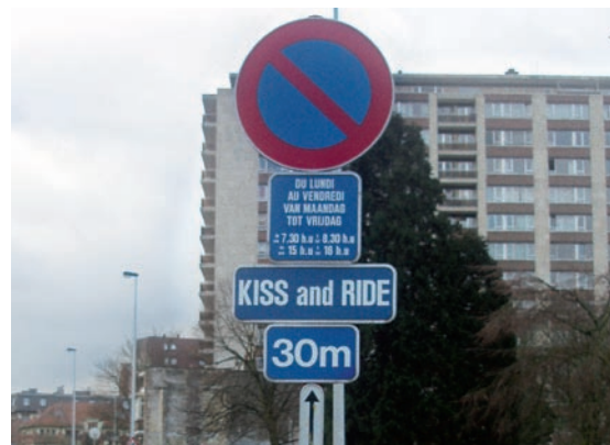
Schaerbeek, École 17. Signal E1 avec un panneau additionnel « Kiss and Ride ».

Certaines communes placent conjointement un panneau spécial dépose-minute. Ce type de panneau permet de rendre la zone bien visible et de clarifier son usage. On peut cependant regretter qu'il n'y ait aucune uniformité dans ce type de panneau (différentes mentions et pictogrammes sont utilisés).