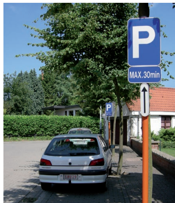
Merelbeke, zone de stationnement de courte durée à proximité de l'école.

Dans certains quartiers où la pression de stationnement est faible, une place de stationnement se trouve aisément. Par contre, là où les places de stationnement sont rares, il peut être nécessaire de créer une zone de stationnement de courte durée (P maximum 15 ou 30 minutes).