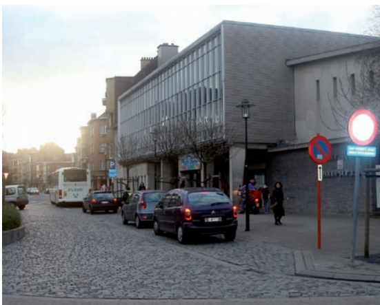
Evere, École Claire Vivre. Dépose-minute sur allée latérale. Possibilité de contourner un véhicule à l'arrêt.

Une zone de dépose-minute peut être aménagée soit sur la voirie, dans la zone de stationnement, soit sur une allée latérale. L'allée latérale peut être aménagée sur le domaine privé de l'école ou sur le domaine public.