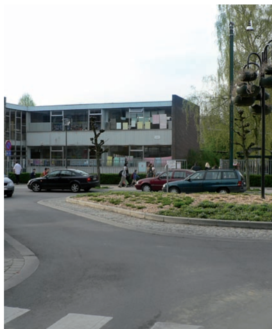
Anderlecht, École Pierre Lairin. Dépose-minute sur voirie située sur un carrefour aménagé en rond-point.