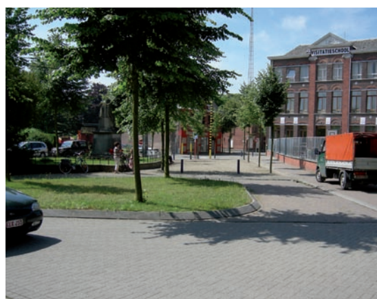
Merelbeek, Visitatie school. Dépose-minute sur une allée latérale en forme de rond-point.

Pour assurer une fluidité maximale de la zone, les manœuvres d'accès et de sorties doivent pouvoir se faire aisément et en quelques secondes. Une zone de dépose-minute aménagée sous forme de rond-point permettra par exemple aux conducteurs d'y accéder et de repartir facilement.