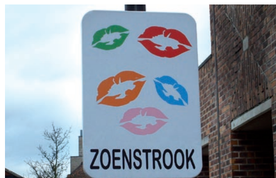
Hasselt, École De Boomgaard. Panneau de la zone dépose-minute appelée « zoenstrook » qui peut être traduit littéralement par « zone de bisous ».