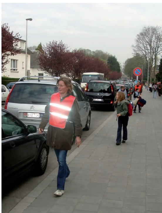
Woluwe-Saint-Pierre, École Materdéli. Parents présents sur la zone de dépose-minute.

Enfin, pour qu'un dépose-minute puisse aussi fonctionner à la reprise, il faut également insister auprès de parents qui arrivent trop tôt pour qu'ils stationnent plus loin. Il faut veiller à ce que les enfants puissent attendre leurs parents sur le dépose-minute. Dans ce cas, les enfants doivent être généralement accompagnés d'un éducateur. Une autre solution est que le dépose-minute soit situé à un endroit bien visible de l'école afin que les enfants puissent sortir dès qu'ils voient leurs parents. Les parents ne s'arrêtent dans ce cas que quelques minutes, le temps d'attendre et d'embarquer leurs enfants.