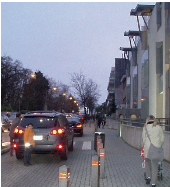
Uccle, École du Val Fleuri. Dépose-minute sur allée latérale, impossibilité de contourner un véhicule à l'arrêt. Des places disponibles en début de zone ne sont pas accessibles.

Une zone de dépose-minute sur allée latérale comporte différents avantages :