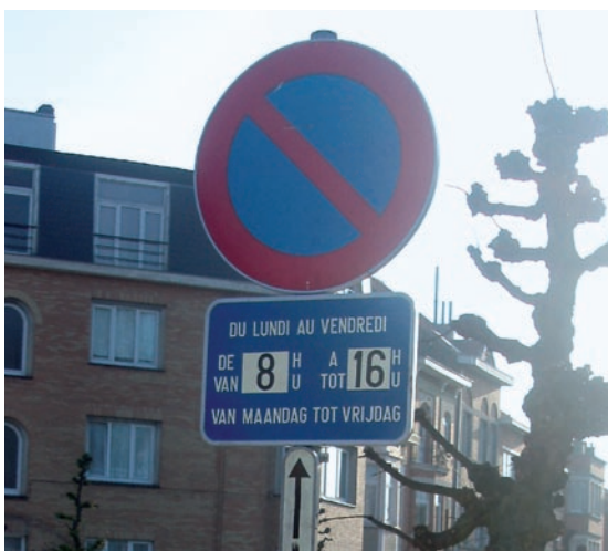
Signal E1 avec panneau additionnel limitant la zone dans le temps.

Pour permettre aux riverains de stationner sur la zone de dépose-minute en dehors des heures de fonctionnement, un panneau additionnel limitant la zone dans le temps peut être placé (exemple: du lundi au vendredi, de 7h30 à 16h30, pendant les périodes scolaires). Si la zone sert uniquement de dépose-minute et