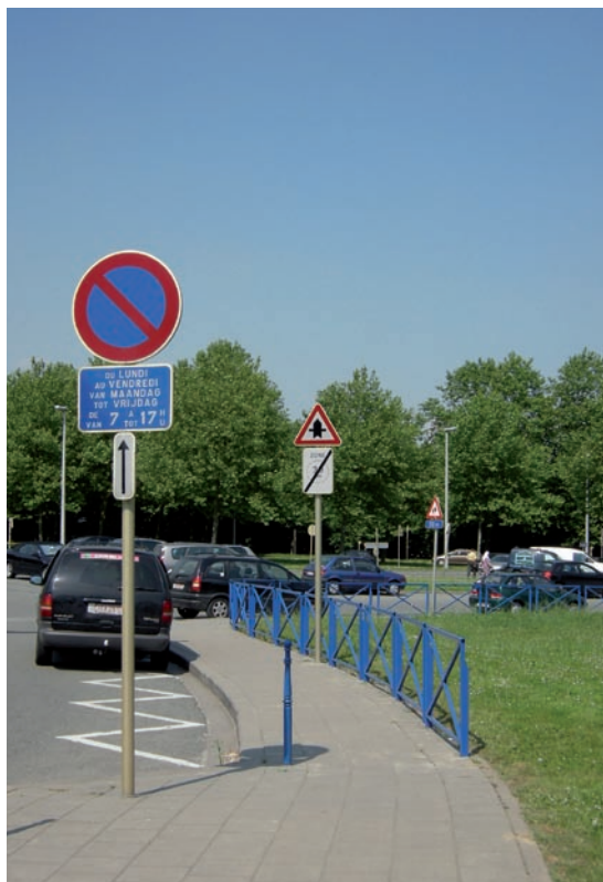
Jette, École Poelbos. Dépose-minute sur voirie, marquage en zigzag et barrières de sécurité.

Le premier élément d'identification est bien entendu le panneau de signalisation (E1) qui donnera en outre un caractère réglementaire à la zone.