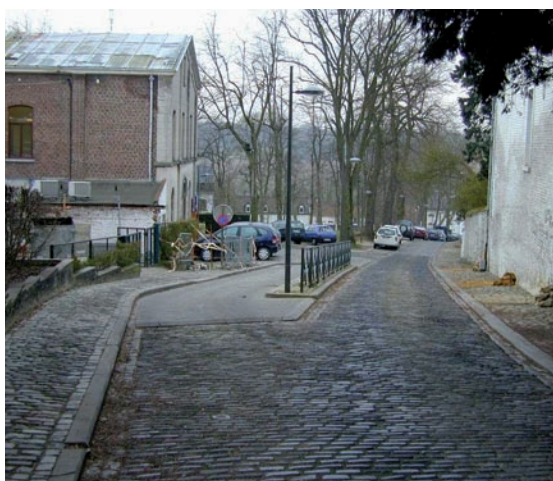
Ohain, École Pierre Van Hoegarden. Dépose-minute sur allée latérale, changement de matériaux et barrières de sécurité.

Par ailleurs, pour rendre la zone bien visible, il est judicieux d'y prévoir un marquage au sol ou un changement de revêtement. Un marquage est souvent plus économique et facilement réalisable qu'un changement de revêtement.