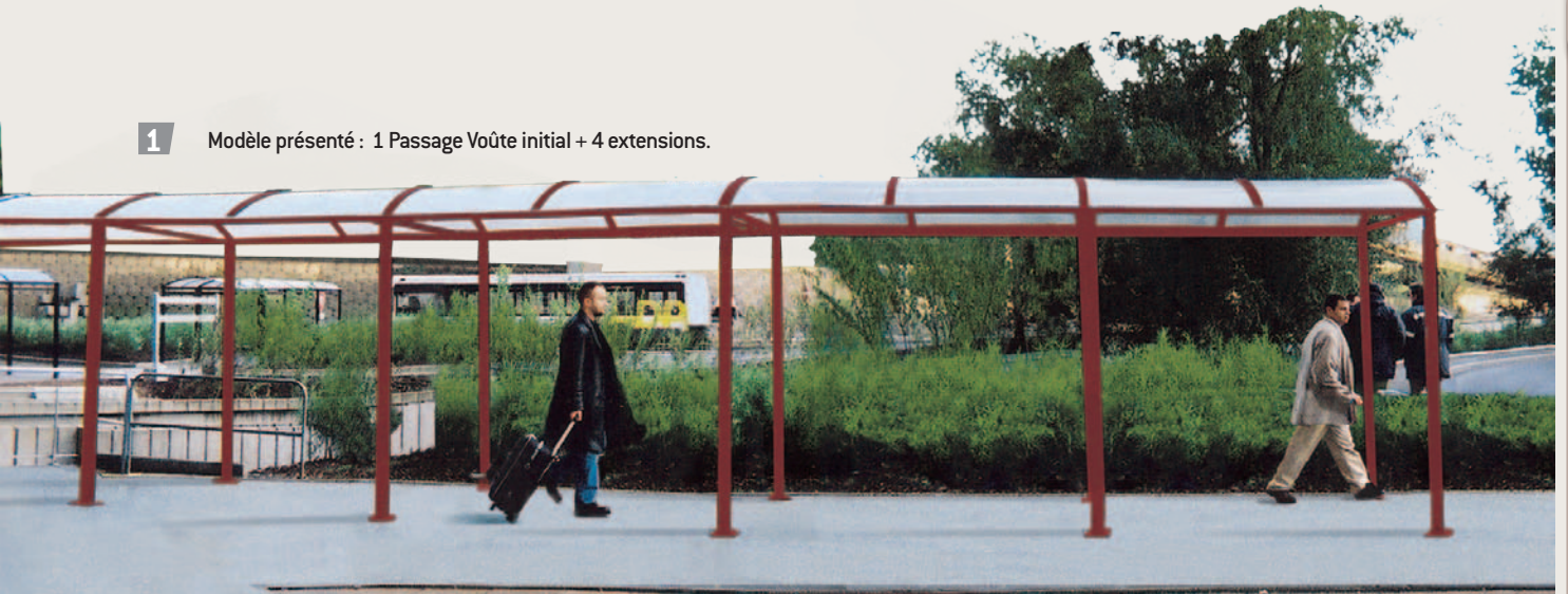
1 Modèle présenté : 1 Passage Voûte initial + 4 extensions.