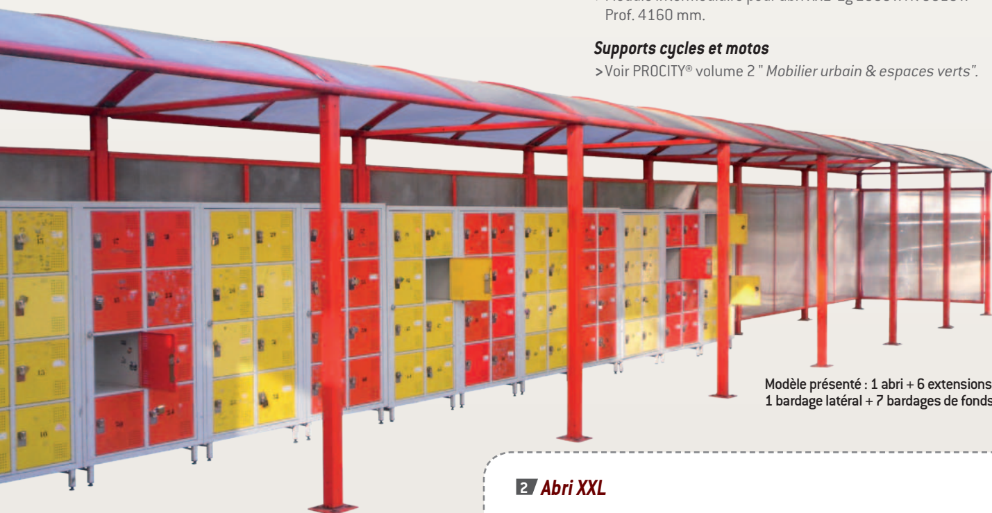
Modèle présenté : 1 abri + 6 extensions + 1 bardage latéral + 7 bardages de fonds.